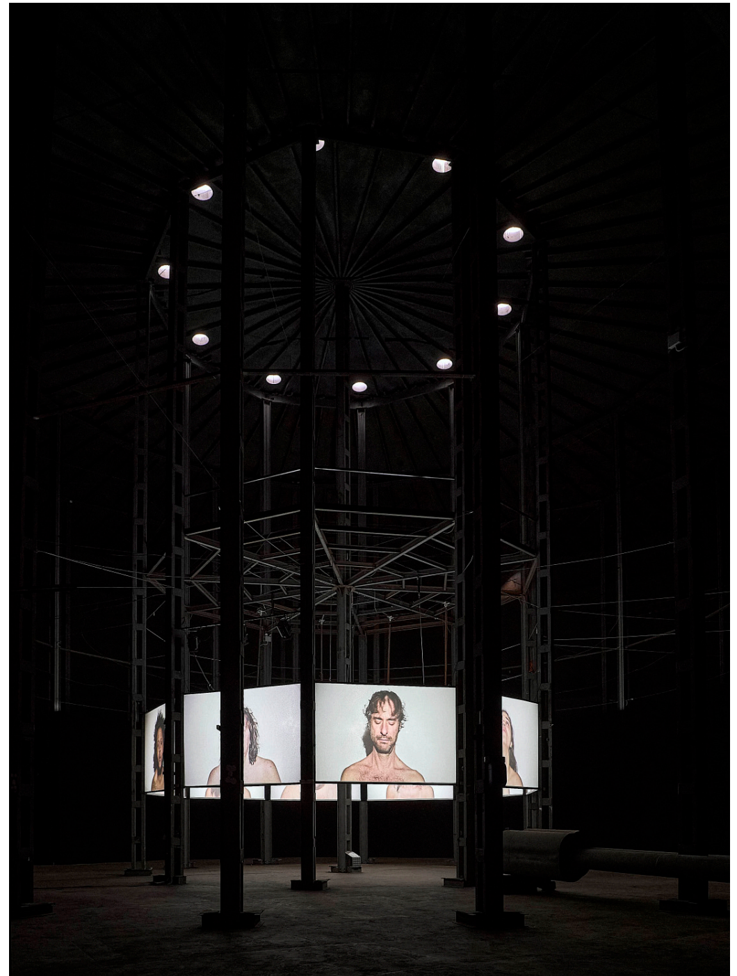
INSTALLATION VIEW AT ESPACIO CULTURAL EL TANQUE, TENERIFE, 2021.

Entre sus residencias artísticas destacan The Watermill Center, Nueva York; The Fountainhead Residency, Miami; Art Omi, Nueva York; The Kaimera Lab, Belloy-Saint-Léonard. Algunos de los espacios remarcables en los que ha expuesto son Instituto Cervantes NY, New York; Arts Santa Mònica, Barcelona; Museo Nacional de Bellas Artes de Cuba, Arte Universal, Cuba; Catinca Tabacaru Gallery, Nueva York; The Delaware Contemporary, Delaware; TEA Tenerife Espacio de las Artes, Santa Cruz de Tenerife; Centro Atlántico de Arte Moderno-CAAM, Las Palmas de Gran Canaria; Mario Mauroner Gallery, Viena; EAC Espacio de Arte Contemporáneo, Montevideo; Casa África, Las Palmas de Gran Canaria; CCET Centro Cultural de España, Tegucigalpa; Musée d'Histoire de la Médecine, París; y Solyanka Gallery, Moscú. Su trabajo se encuentra en colecciones permanente como en el CAAM Centro Atlántico de Arte Moderno, Gran Canaria; TEA Tenerife Espacio de las Artes, Tenerife; Casa África, Gran Canaria o Museos de Tenerife, Tenerife. Se han publicado reseñas de su trabajo en Observer , El País , Forbes , Paper Magazine , Wall Street International Magazine , Cools La Vanguardia , entre otros.