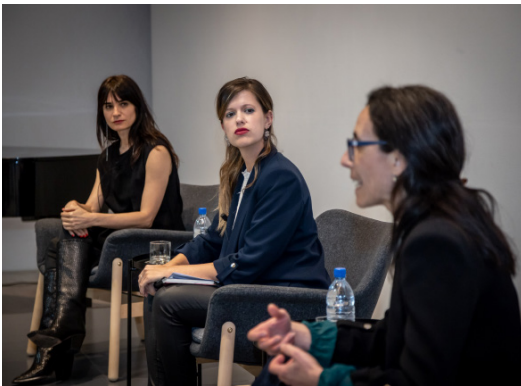
DOCUMENTARY PREMIERE 'MONUMENTA', MUSEO CANARIO, GRAN CANARIA, 2024.