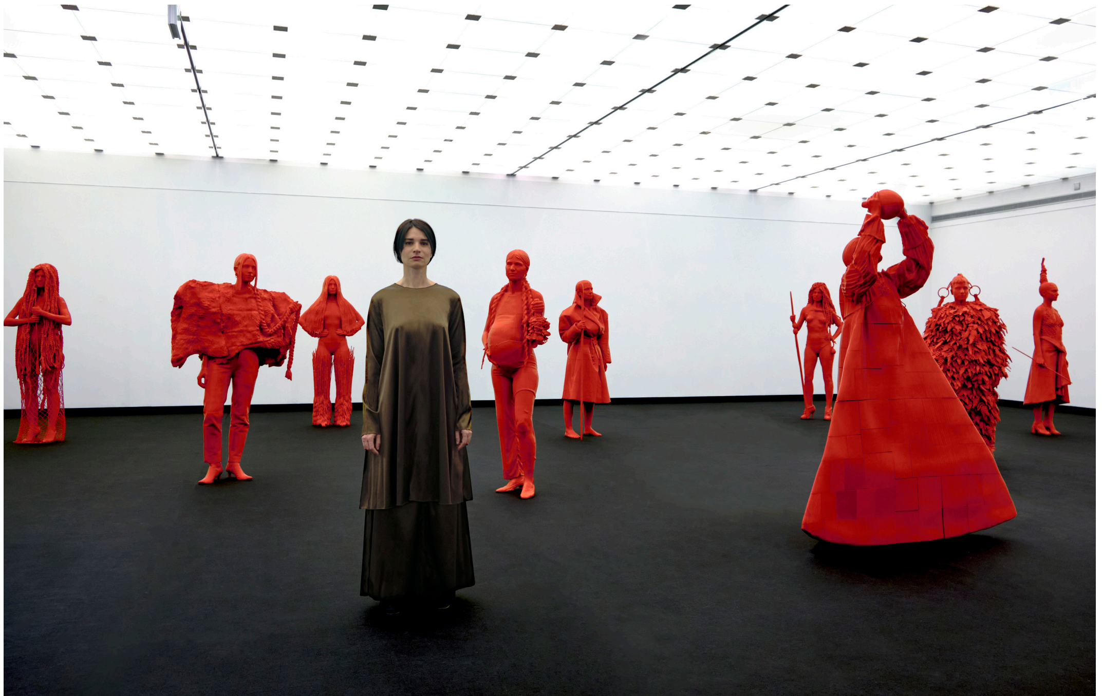
INSTALLATION VIEW AT MUSEO DE LA NATURALEZA Y ARQUEOLOGÍA, TENERIFE, 2022.