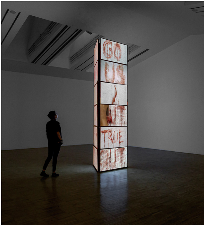
INSTALLATION VIEW AT CATINCA TABACARU, NEW YORK, 2019.