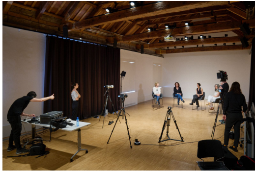
'PARTO' IN DIALOGUE, SANTA MÓNICA, BARCELONA, 2024.