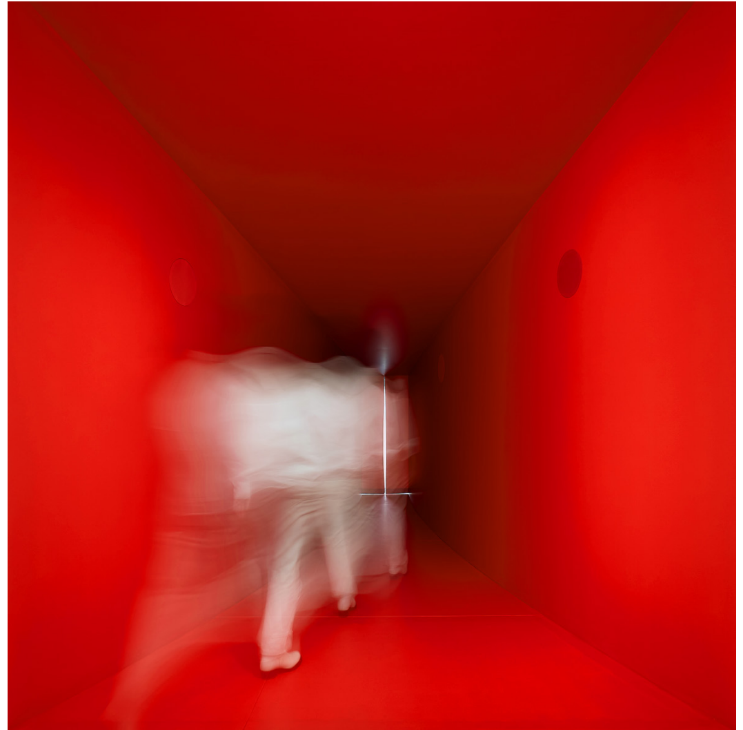
SOUND INSTALLATION VIEW, SANTA MÒNICA, BARCELONA, 2024.