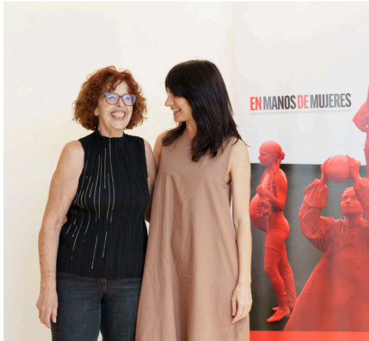
PRESENTATION: "EN MANOS DE MUJERES. A STUDY ON THE INTERNATIONAL VISIBILITY OF CONTEMPORARY SPANISH ART;" MUSEO NACIONAL THYSSEN-BORNEMISZA, MADRID, 2023.