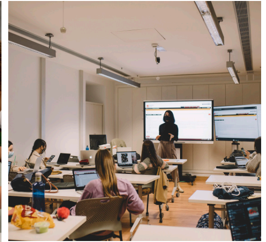
'INMATERIAL LAB'; UNIVERSIDAD EUROPEA DE CANARIAS, LA OROTAVA, 2021.