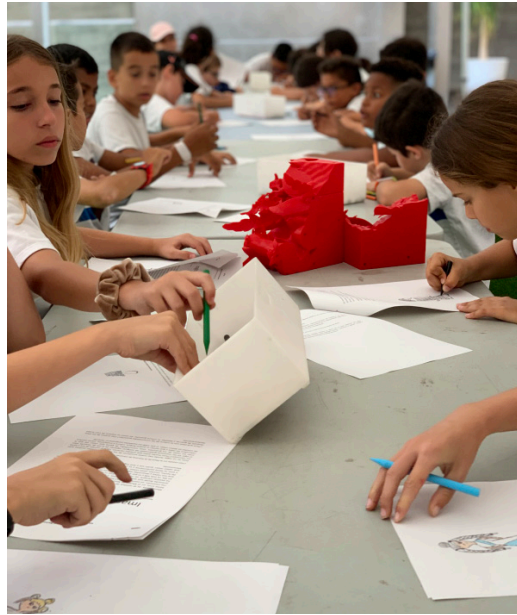
WORKSHOP 'IMAGINA TU MONUMENTO'; MUNA, MUSEO DE LA NATURALEZA Y EL HOMBRE, SANTA CRUZ DE TENERIFE 2022.