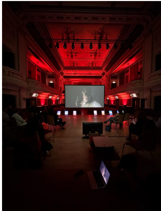
KINEMA IKON, ARAD PHILARMONIC, ROMANIA, 2024