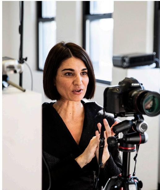
'LORO' OPEN CALL, THE WATERMILL CENTER, NEW YORK, 2020.