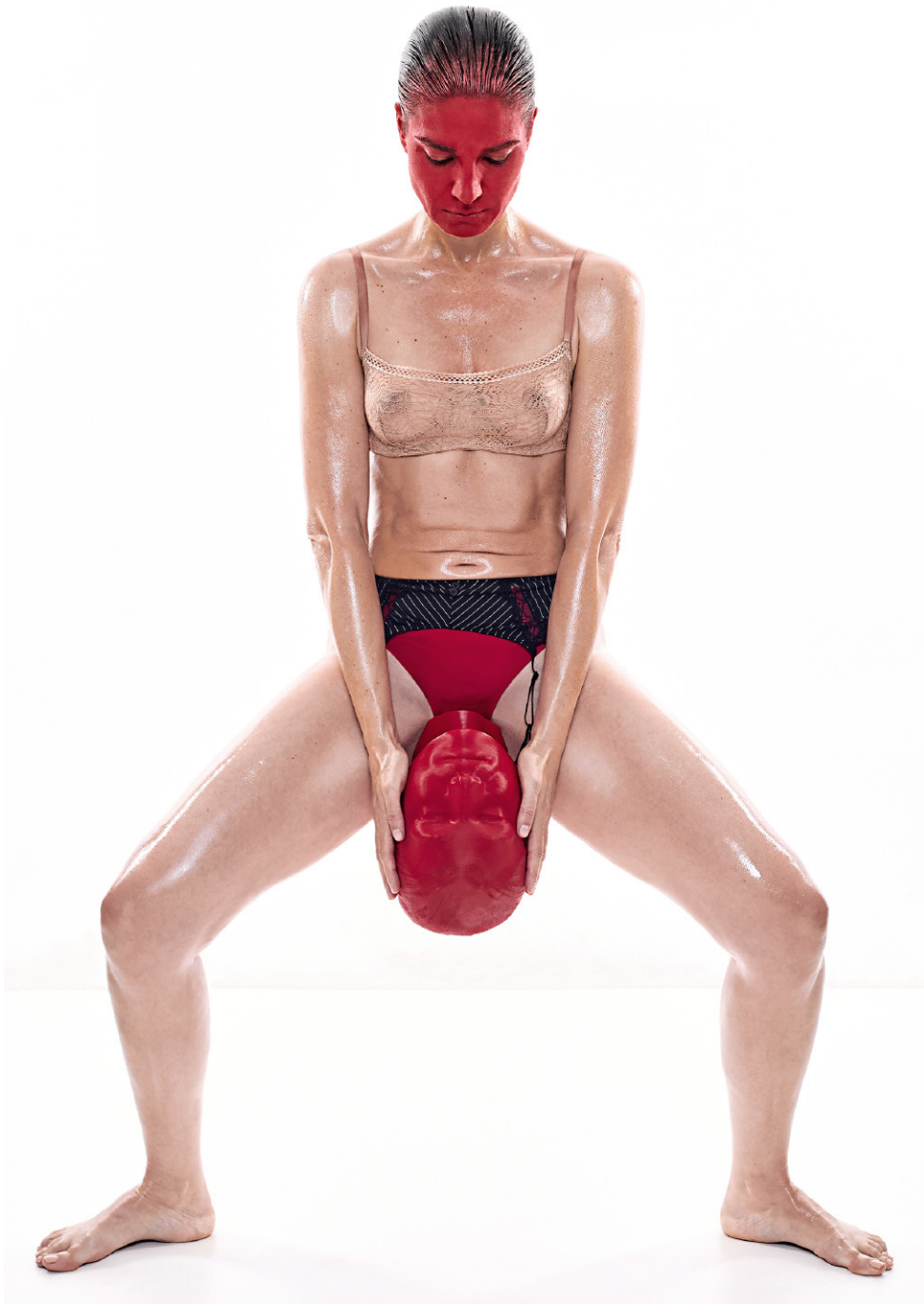
'PARTO DE MÍ PROJECT STILL, 2024.