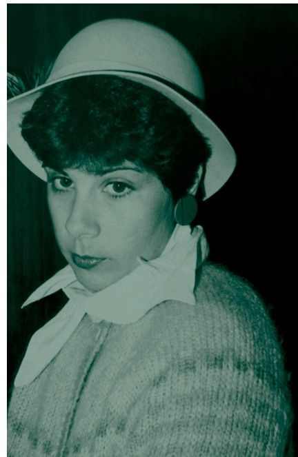
MAMÁ, 1984-2019. LENTICULA8R PHOTOGRAPHY. 59 X 47.2 IN.