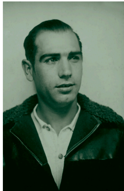
ABUELO, 1928/2019. LENTICULAR PHOTOGRAPHY. 39.4 X 31.5 IN.