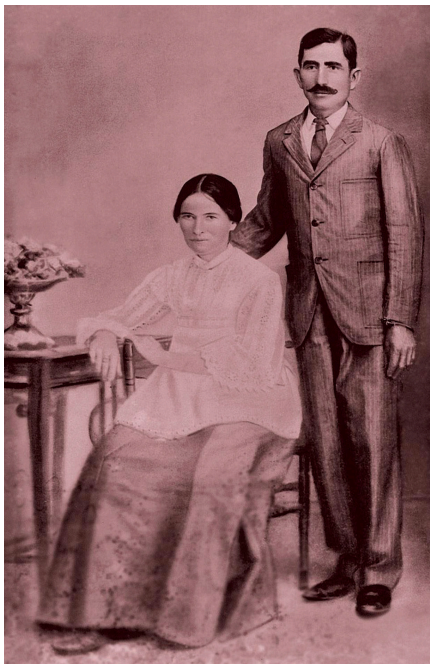
BISABUELA, 1931-2019. LENTICULAR PHOTOGRAPHY. 19.7 X 13 IN.