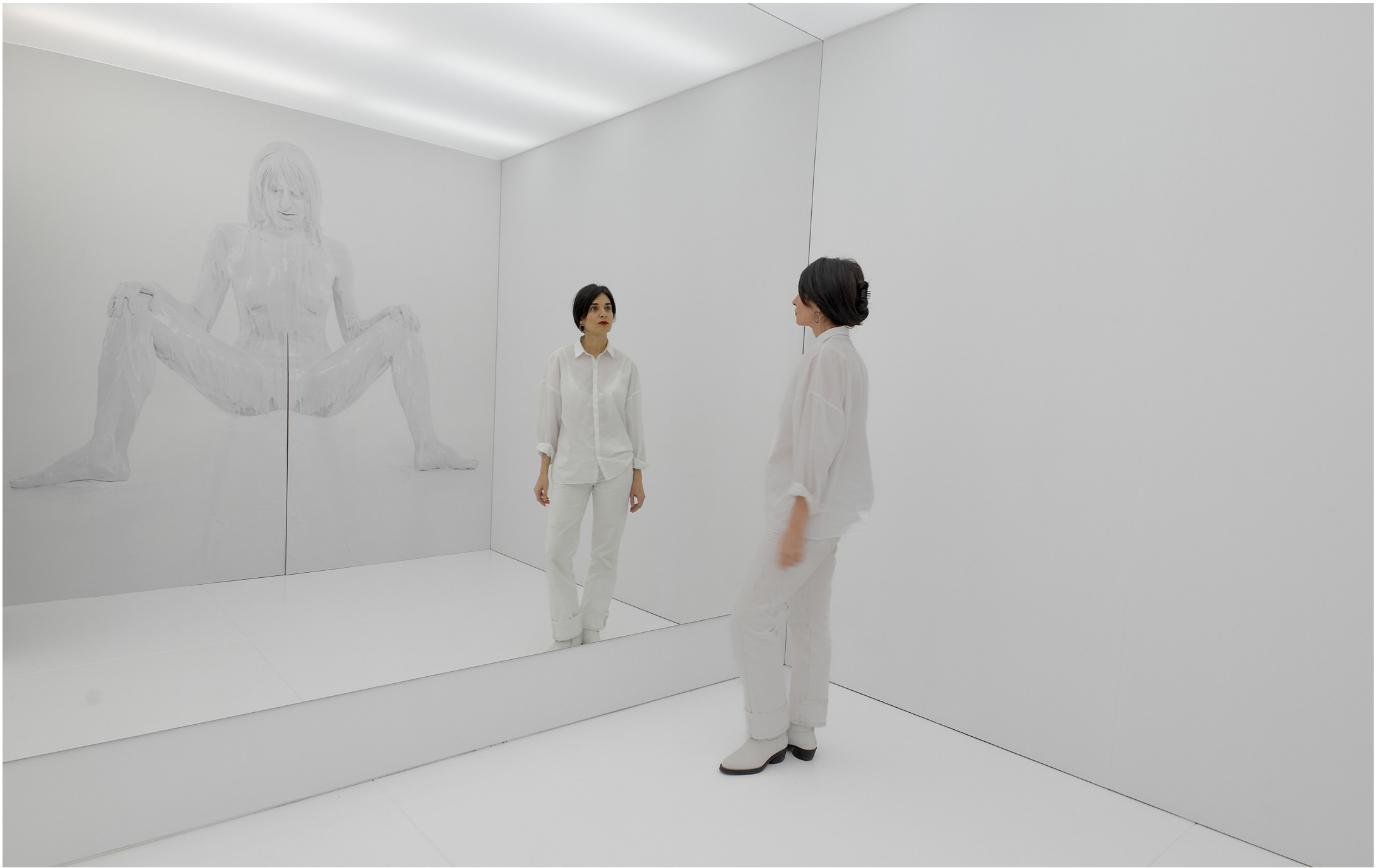
INSTALLATION VIEW, ARTS SANTA MÒNICA, 2024, BARCELONA