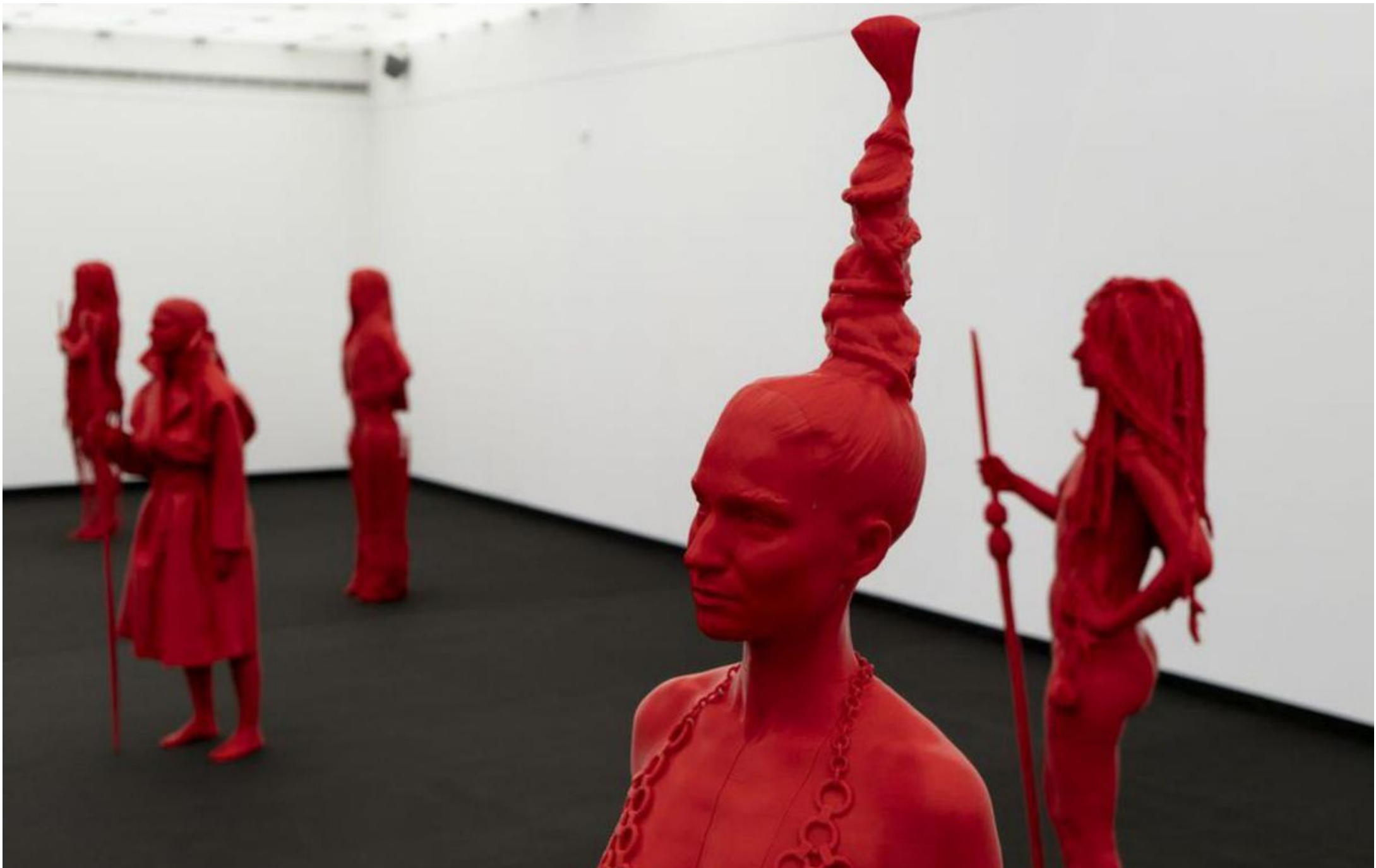
INSTALLATION VIEW AT MUSEO DE LA NATURALEZA Y ARQUEOLOGÍA, 2022, TENERIFE.