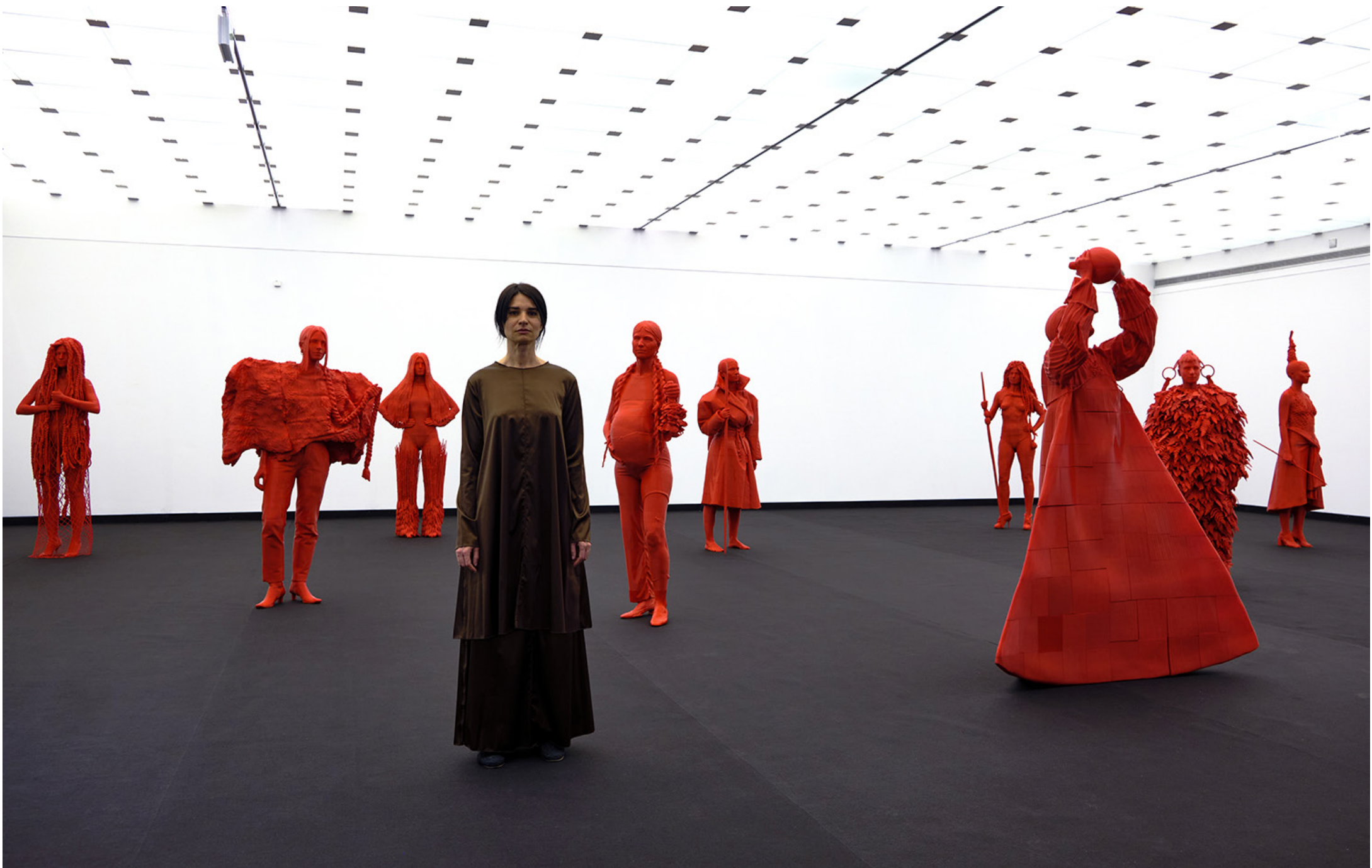
INSTALLATION VIEW AT MUSEO DE LA NATURALEZA Y ARQUEOLOGÍA, 2022, TENERIFE.