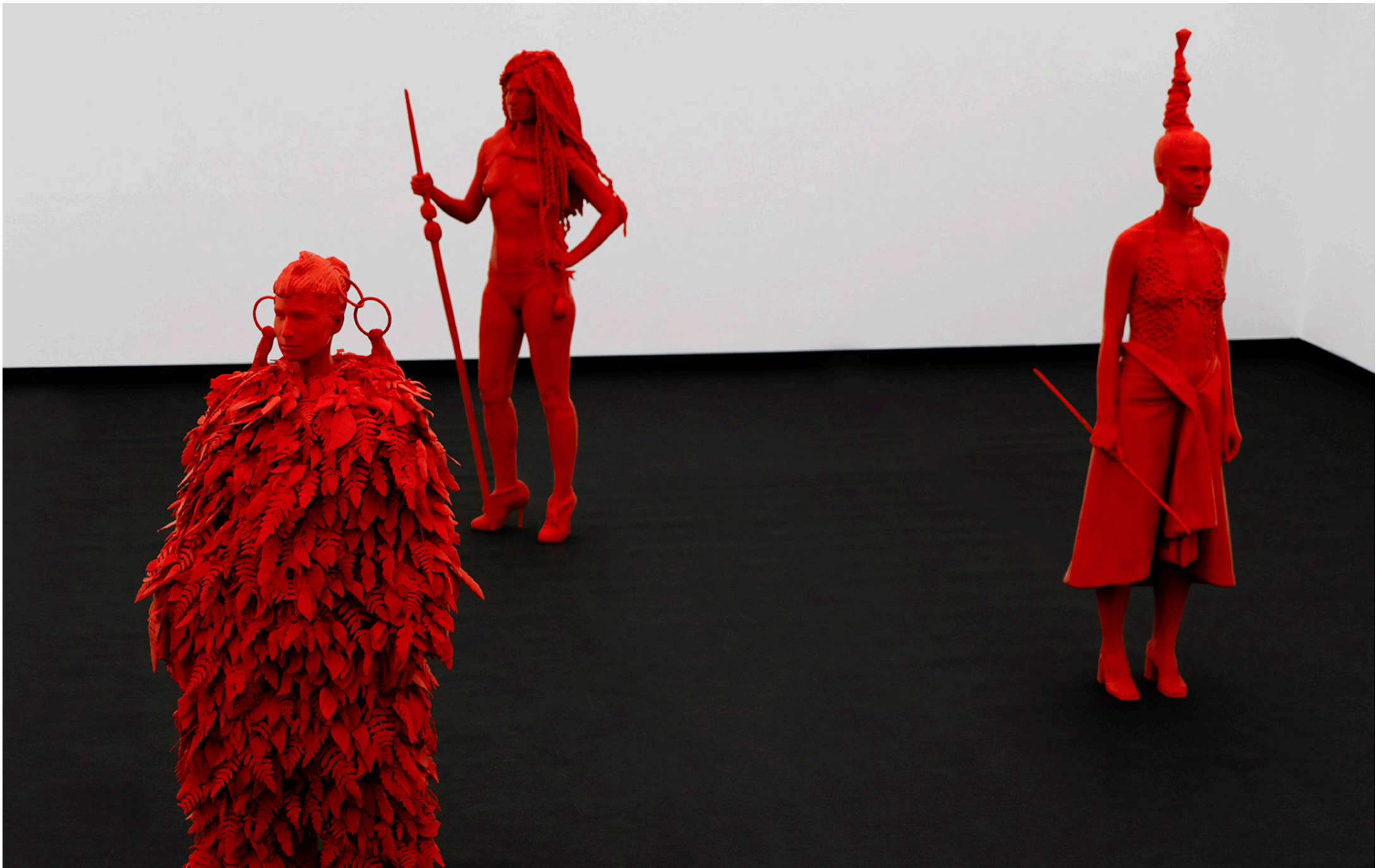
INSTALLATION VIEW AT MUSEO DE LA NATURALEZA Y ARQUEOLOGÍA, 2022, TENERIFE.